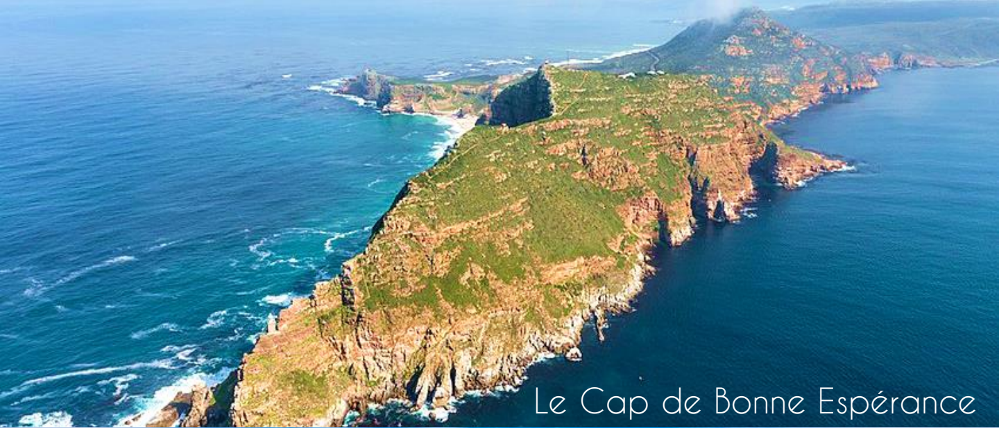
Le Cap de Bonne Espérance